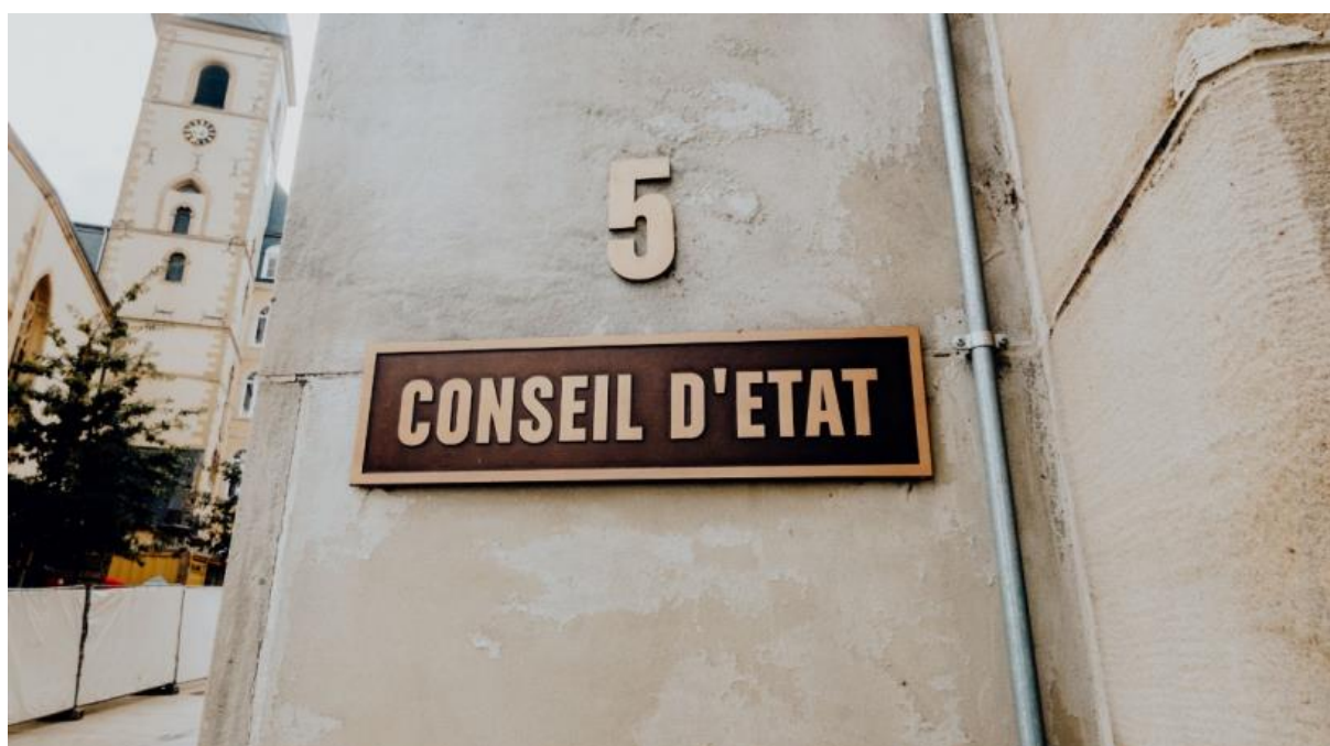
De Staatsrot äussert Bedenken zum Covid-Gesetz.

Déi zwou Instanze begrësse prinzipiell, datt d'Leit nees Fräiheete sollen zeréckkréien, elo, wou déi epidemiologesch Situatioun sech verbessert huet. De Staatsrot konstatéiert awer : am HORECA an am ëffentleche Beräich géif et grouss Ouverturë ginn.